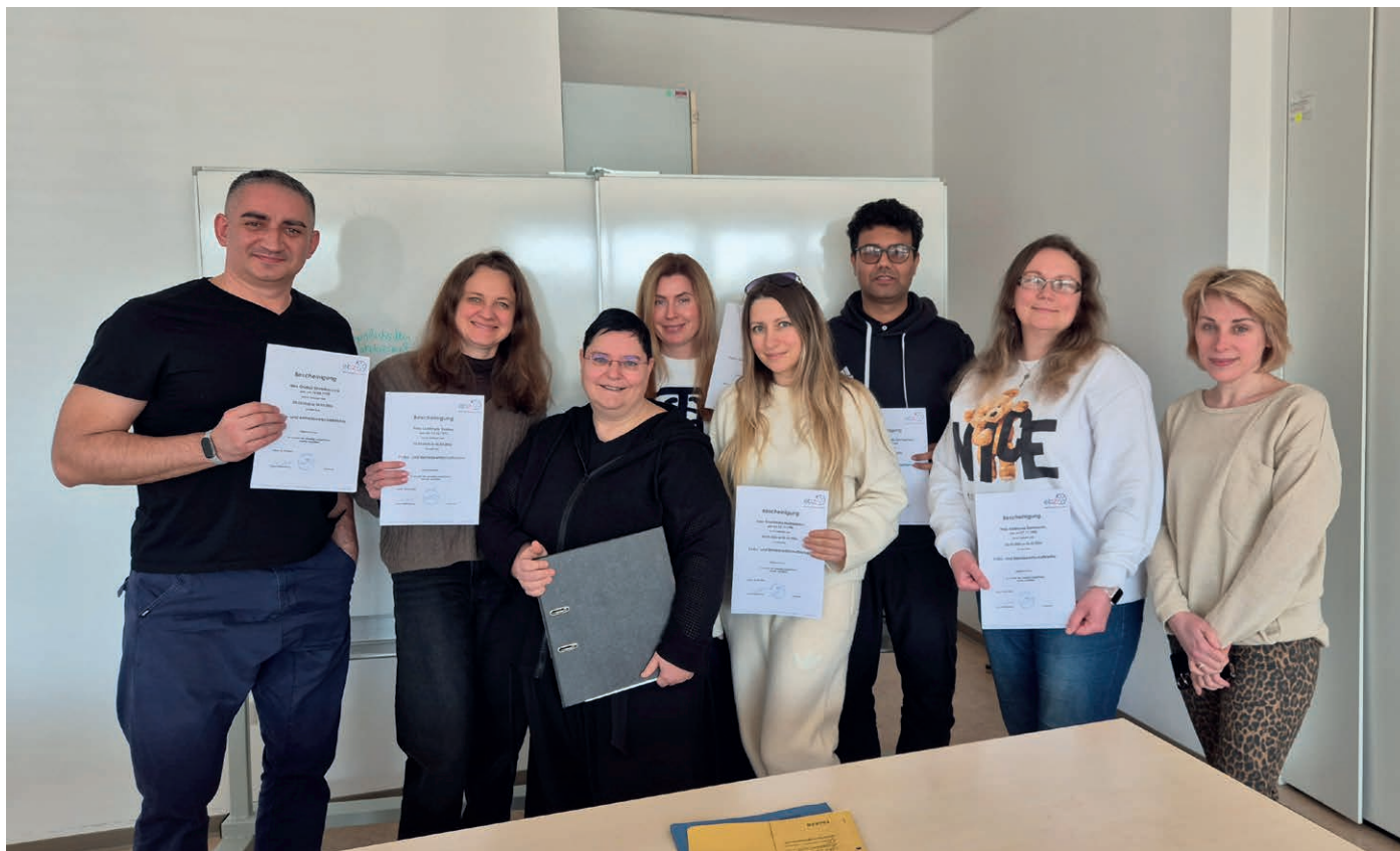
Teilnehmende der Buchhaltungskurse im Januar und Februar 2026

Anmeldung und Fragen: yulia.finke@ebz-verbund.de Tel.: 0361 51807-532