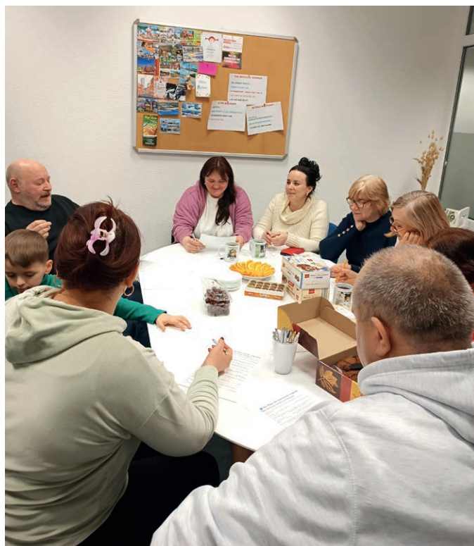
Sprachcafé beim BWTW Gera

Das Angebot von BLEIBdran+ findet jeden Mittwoch ab 17 Uhr statt. Die Teilnahme ist freiwillig und kostenlos. Wie in einem richtigen Café gibt es Snacks und Getränke. In ungezwungener Runde wird erzählt, gespielt, gelacht und manchmal werden auch kleinere Ausflüge zu Geras Sehenswürdigkeiten unternommen.