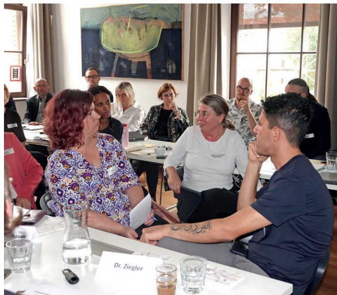
Fachtagung zum Kompetenz- und Transferprozess am 11.09.2025

Eine Zielgruppe, deren Arbeitsmarktintegration bisher deutlich verzögert verläuft, ist die der Frauen aus den wichtigsten Asylherkunftsländern (TOP 8). Die am Prozess beteiligten Einrichtungen verwiesen hierzu vor allem auf ihre Zusammenarbeit mit dem über den Europäischen Sozialfonds Plus finanzierten Bundesprogramm „MY TURN – Frauen mit Migrationserfahrung starten durch“. So kooperiert das Jobcenter Vogtland mit dem Projekt „Migrantinnen offensiv ins Vogtland eingliedern (MoVe)“ 3 . Dabei werden in gemeinsamen Fallbesprechungen zwischen den Coaches des Trägers und den Integrationsfachkräften des Jobcenters u. a. weitere Fördermöglichkeiten, z. B. im Bereich Sprache, abgestimmt. Aus Sicht des Jobcenters stellt das Projekt eine wich-