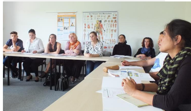
Ein Blick in den Kurs „Wege in die Pflege“