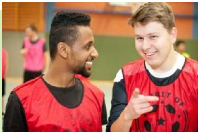
So gelingt Integration spielend leicht.

Wenngleich unsere Sportangebote immer offen für alle sind erreichen wir auch hier in erster Linie die Männer. Hier knüpfen sich andere Überlegungen an.