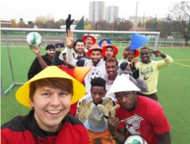
Spaß am Spiel – Spaß an der Gemeinschaft

Ich betreue immer donnerstags ein Sportangebot hauptsächlich für unbegleitete minderjährige Flüchtlinge. Das ist jetzt in der Teilnehmerzahl rückläufig – aber nur, weil wir viele Jugendlichen an Fußballvereine vermitteln konnten, wo sie jetzt im regelmäßigen Spielbetrieb integriert sind. Das war unser Ziel – das ist wichtig für die Sprache, um Freunde zu finden, um anzukommen.