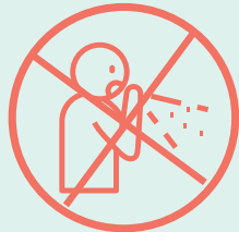
ግቡእ ጥንቃቄ ኣብ ምህንጣስን ምስዓልን