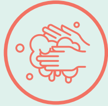
ኢድካ ብሙሉእ ተሓጸብ