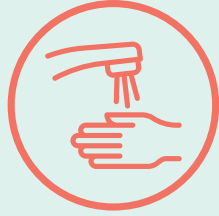
ኢድካ ብስርዓት ኣብ ገግዜ ተሓጸብ