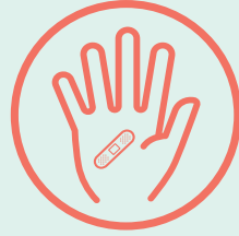
ቁስሊ ምስ ዝህልወካ ሸፍኖ