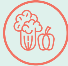
መግብታትካ ብጽሬት ምሓዝ