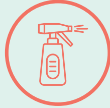
ገዛኻ ብጽሬት ሓዝ