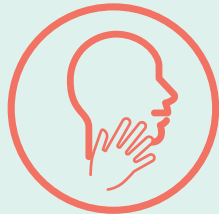
ብኢድካ ገጽካ ኣይትሓዝ