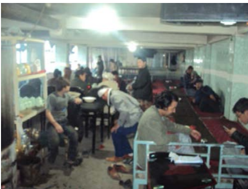
Gemeinschaftlicher Essens- und Schlafraum in Restaurant

In privat organisierten Verstecken bezahlen Betroffene oft nicht nur die Miete, sondern auch dafür, nicht veratet zu werden. So gibt es zwar regulär gemietete Wohnungen ortsabhängig ab 5000Afn/53,20€ im Monat. 197 Abgeschobene müssen jedoch teils sogar bei engen Verwandten, die eigenen Wohnraum besitzen, bis zu 8000Afn/85,20€ pro Monat Miete für ein Zimmer zahlen und mitunter wird gefordert, dass sie die Miete der gesamten Familie tragen, um selber bleiben zu dürfen. Unter den Abgeschobenen waren das bisher bis zu 300€. Bei Vermietern von Verstecken, die in keiner engen Beziehung zum Abgeschobenen stehen, sind die geforderten Beträge oft um ein Vielfaches höher. Grundsätzlich steigen die Kosten je fremder und ortsunkundiger Betroffene sind, und je auffälliger der Aufenthalt in Europa aufgrund des Auftretens oder des Kontaktes mit Ausländern ist.