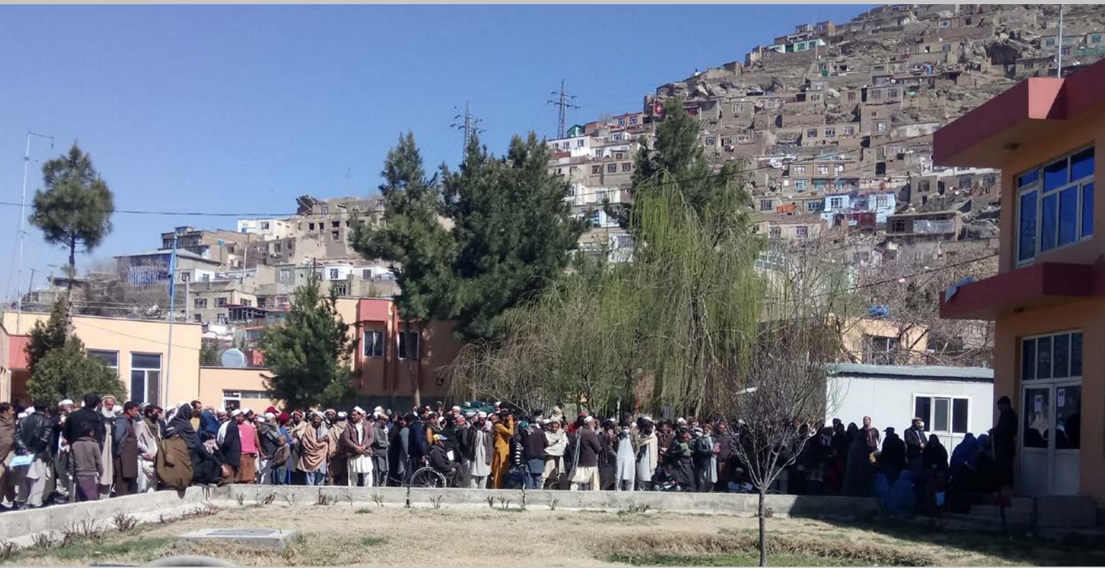
Delegation Binnenvertriebener im MoRR mit einer Petition für eine Landzuteilung – kurz bevor sie mit Stockschlägen vom Gelände gejagt wurden. Kabul, 2020.