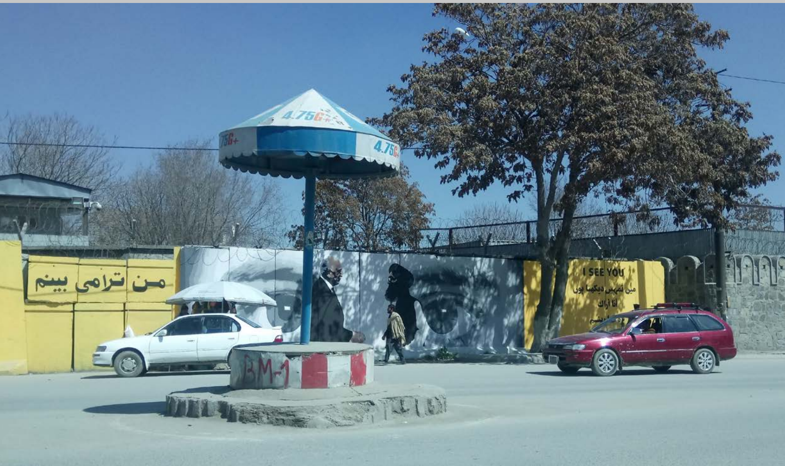
StreetArt des Künstlerkollektivs ArtLords. Handschlag zwischen Zalmay Khalilzad und Mullah Baradar, den Unterhändlern des USA-Taliban Abkommens im Februar 2020 – genau beobachtet von der Zivilgesellschaft ohne Mitspracherecht. Kabul, 2020.