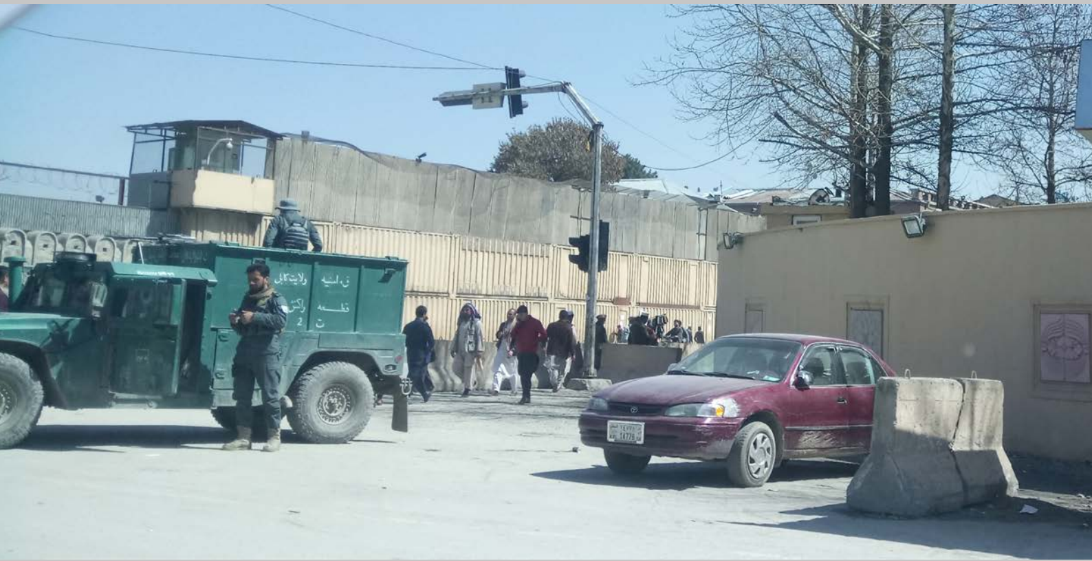
Schutzvorkehrungen Kabul Innenstadt, 2020.