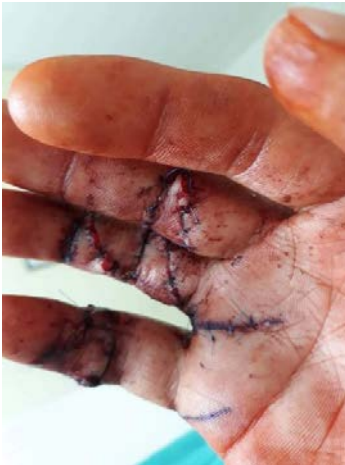
Handverletzung kurz vor Abschiebung.

Der oft akute Bedarf Abgeschobener an medizinischer Versorgung hat mehrere Gründe. So werden oft Behandlungsbedürftige abgeschoben. Es gibt zwar nach Aussage eines Mitarbeiters des MoRR eine Absprache zwischen der deutschen Bundesregierung und dem MoRR, dass schwer Kranke nicht abgeschoben und im